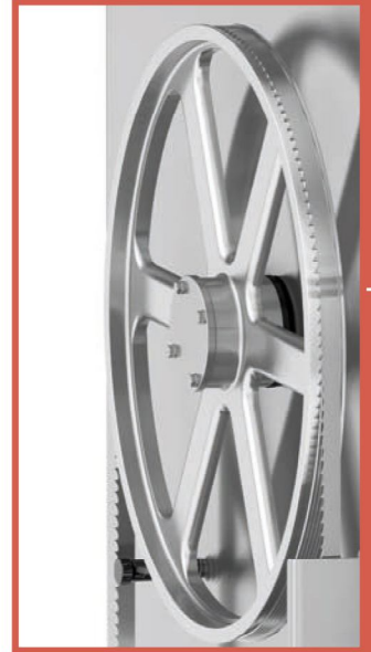
Stainless steel pulleys with double rim. Poulies en acier inoxydable avec double rebord. Poleas inoxidable con doble pestaña. Edelstahl Laufrad mit Doppelbord.